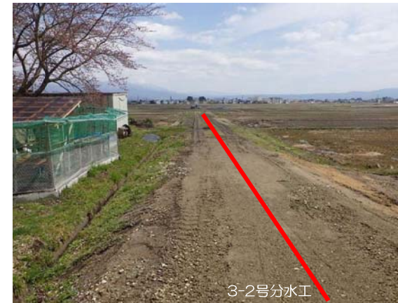
令和3年度以降工事箇所(予定)