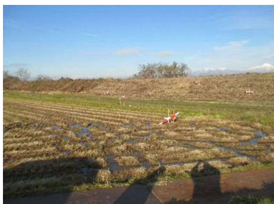
仮堤防設置箇所丁張り状況①