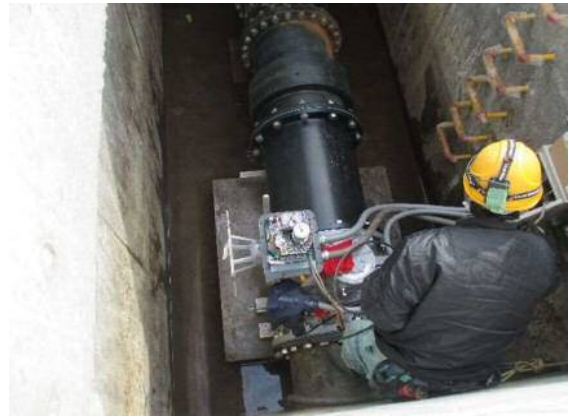
電気制御部設置状況