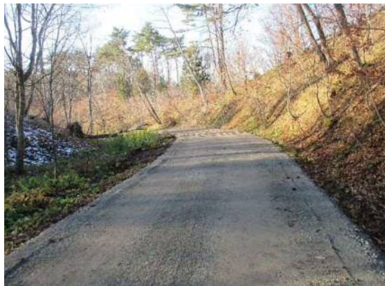
工事用道路整備状況①