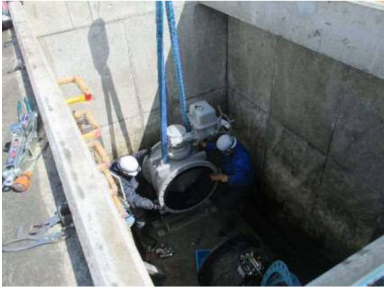
電動バタフライ弁設置状況