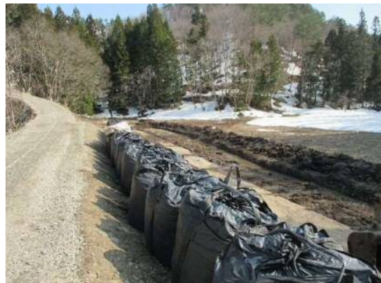
工事用道路整備状況②(仮設工)