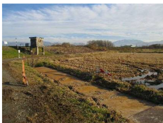
仮堤防設置箇所丁張り状況②