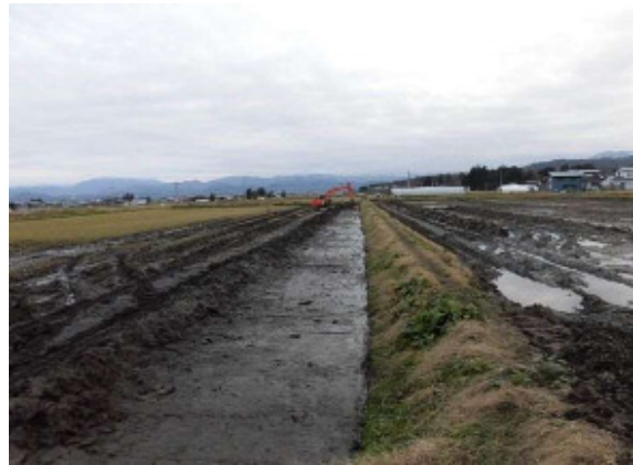
補完工事状況(暗渠排水)