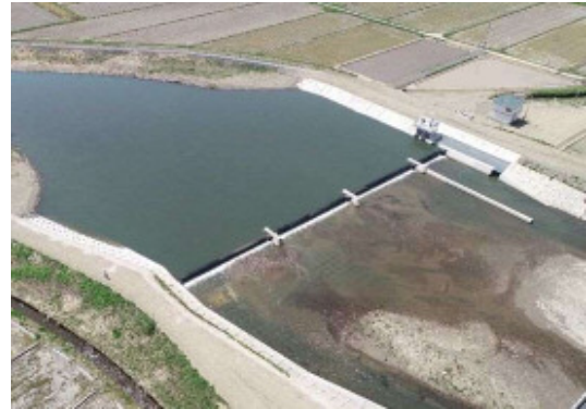
栗村頭首工完成全景