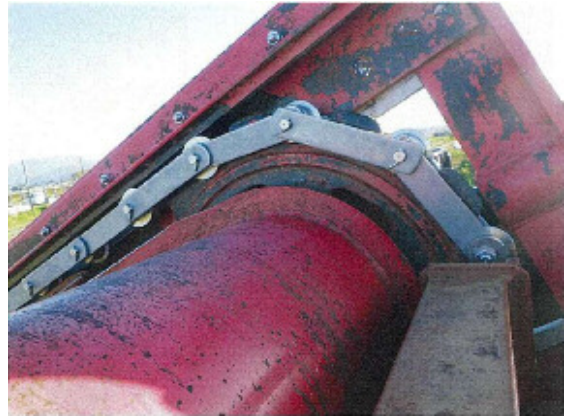
チェーン据付状況