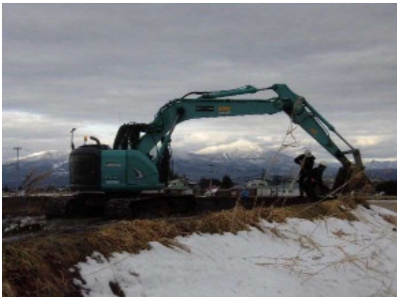
補完工事状況(畦畔の石礫除去)