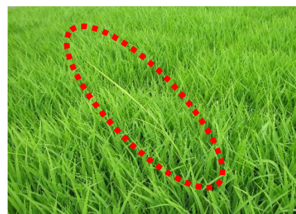
図3 ばか苗病(育苗時)