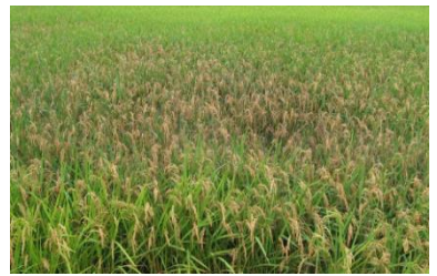
図 3 : 穂いもち発生ほ場