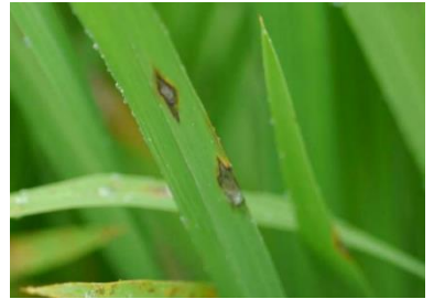
図 2 : 葉いもちの病斑