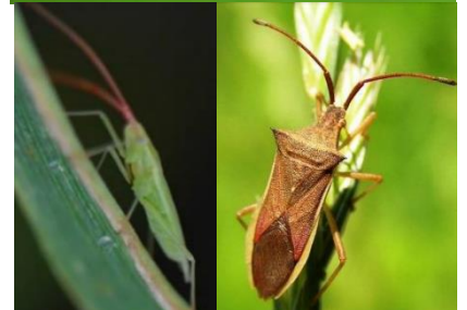
図 6 : 会津管内の主な斑点米カメムシ。アカスジカスミカメ(上)、アカヒゲホソミドリカスミカメ(左下)、ホソハリカメムシ(右下)