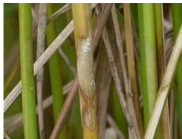
図 4 : 葉鞘に発生した紋枯病の病斑